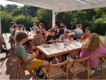
Viele Konfis hatten einen Salat mitgebracht

Grillabend mit den Vor- und Hauptkonfirmanden und bereits Konfirmierten Mitte Juni in Heisfelde.