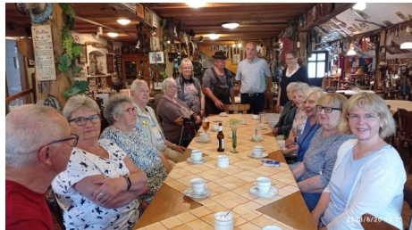
Kaffeetafel nach Besichtigung des Museums (Text und Bilder: E. Hündling)