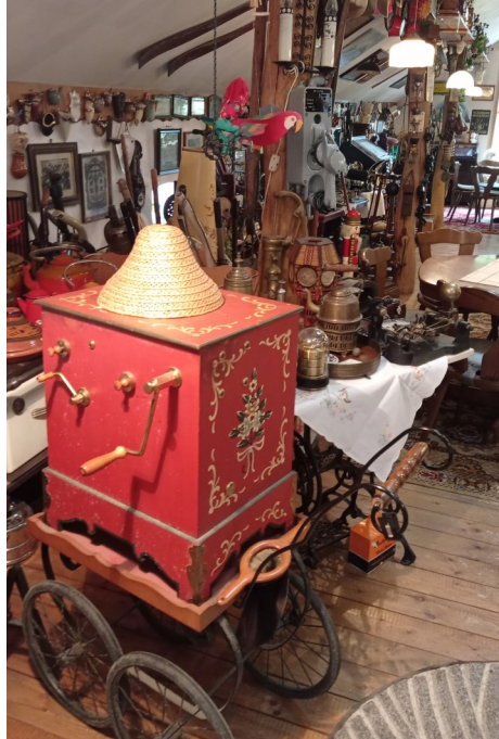
Von der Drehorgel waren lustige Melodie zu hören.

aufstocken oder wieder ergänzen möchte, kann wahrscheinlich fündig werden. Manches wird nämlich auch zum Kauf angeboten.