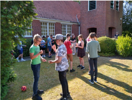
Cooler Spiele auf dem Rasen